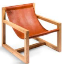
Biobüffel-Leder Gestell: Eiche natur geölt