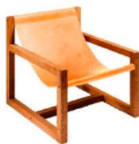
Sattel-Leder Gestell: Raucheiche