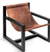
Vintage-Leder Gestell: Eiche schwarz