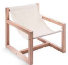
Pure Cotton Gestell: Eiche weiß gekälkt