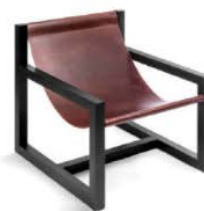
Nature-Leder Gestell: Eiche schwarz